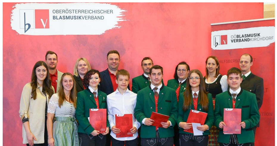
Verleihung der Jungmusikerleistungsabzeichen

Diese freiwilligen Ausbildungen stellen die Grundlage für die Hilfe in Notsituationen unserer Bürgerinnen und Bürger dar, deshalb möchte ich meinen ausdrücklichen Dank für das Engagement aussprechen!