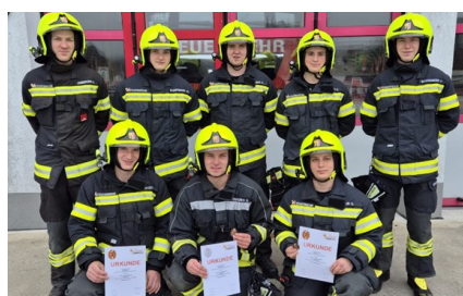
Absolventen ASLP

Damit verfügt die Feuerwehr Nußbach nun über 36 ausgebildete Atemschutzträger.