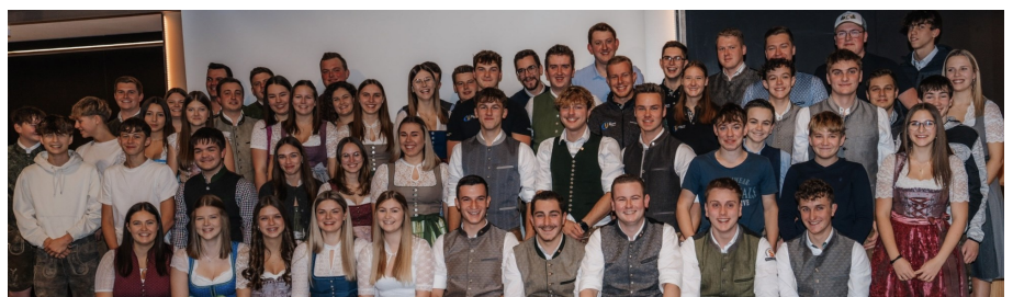
Jahreshauptversammlung der Landjugend Nußbach

Wir bedanken uns bei den beiden herzlich für ihren großartigen Einsatz, ihr Engagement und die viele Zeit, die sie in die Landjugendarbeit gesteckt haben!