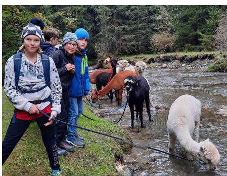
Alpakawanderung im Salzkammergut

1. Klassen – Kennenlernwoche in Altenmarkt: Gleich zu Beginn im Oktober verbrachten unsere ersten Klassen eine abwechslungsreiche Woche in Altenmarkt im Pongau. Wie jedes Jahr standen ein Schwimmschwerpunkt sowie das bessere Kennenlernen im Mittelpunkt.