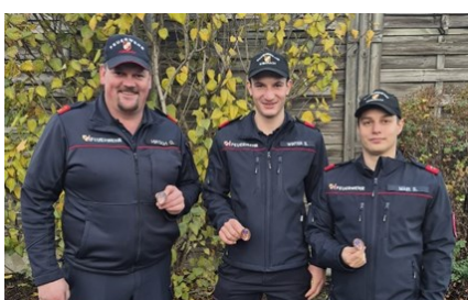
Träger des SAN-Abzeichen

Drei Kameraden stellten bei der ersten SAN-Leistungsprüfung an der Landesfeuerwehrschule in Linz ihr Können im Bereich Erste Hilfe unter Beweis.