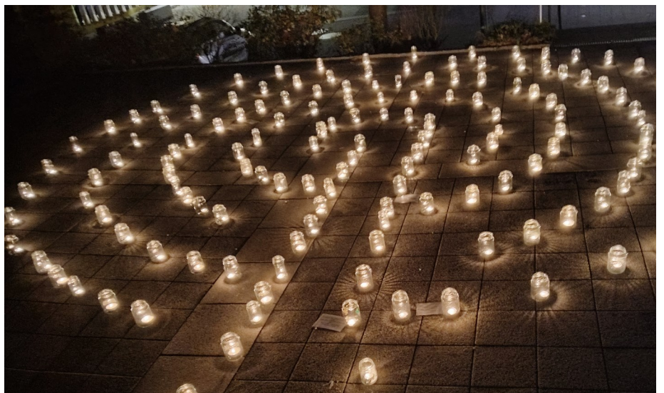
Wege und Symbole aus Teelichter

Beschreiben kann man das kurzum so: bewusst Zeit nehmen, einen vorgegebenen Weg zwischen Lichtern gehen, Texte zum Nachdenken lesen und sich bei verschiedenen Stationen selbst einbringen.