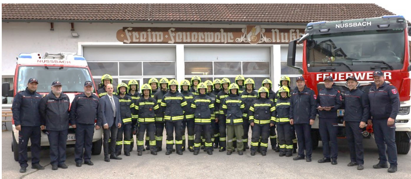
Die drei Gruppen der FF Nußbach nach erfolgreich abgeschlossener technischer-Hilfeleistungs-Prüfung (THL)

Empfang genommen werden. Sie zählt zu den modernsten und leistungsstärksten Pumpen am Markt und erreicht eine Förderleistung von 2.050 Litern pro Minute.