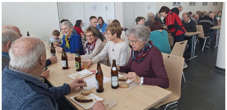
Gemeinsamer Genuss der frischen Bratwürstel

Zahlreiche Besucherinnen und Besucher nutzten die Gelegenheit, die frisch gegrillten Bratwürstel zu genießen. Die Mannschaft der Ortsgruppe Nußbach sorgte mit viel Einsatz und Freude für das leibliche Wohl.