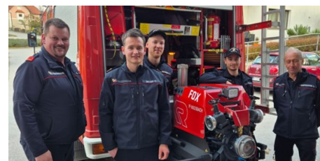
Neue Tragkraftspritze

Zu Jahresbeginn wurde beschlossen, die 26 Jahre alte Tragkraftspritze in Wimberg zu erneuern. Ende Oktober konnte die neue FOX 4 der Firma Rosenbauer in