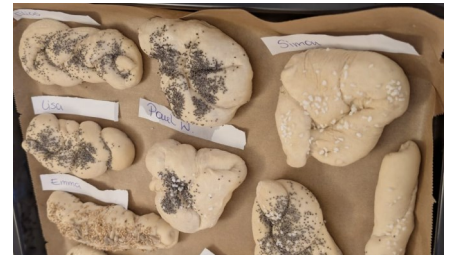
Gebackenes Gebäck

„Basteln“. Egal ob beim Dinkelmaus bemalen, beim Gestalten eines Schneekugelglases oder Bemalen & Zusammenbauen einer Etagere – die Kinder bastelten fleißig mit und hatten sehr viel Spaß.