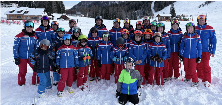
Die Naturfreunde Nußbach-Wartberg mit neuer Vereinskleidung