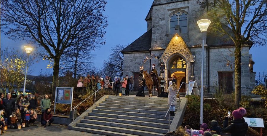
Viele Besucher beim Martinsfest

Am 11.11.2025 wurde wieder das Martinsfest gefeiert. Dank der Vorbereitungen des Kindergartenteams mit den Kindern konnte der Umzug vom Kindergarten zur Kirche, der Feier und anschließendem Ausklang im Feuerwehrhaus erfolgreich abgehalten werden.