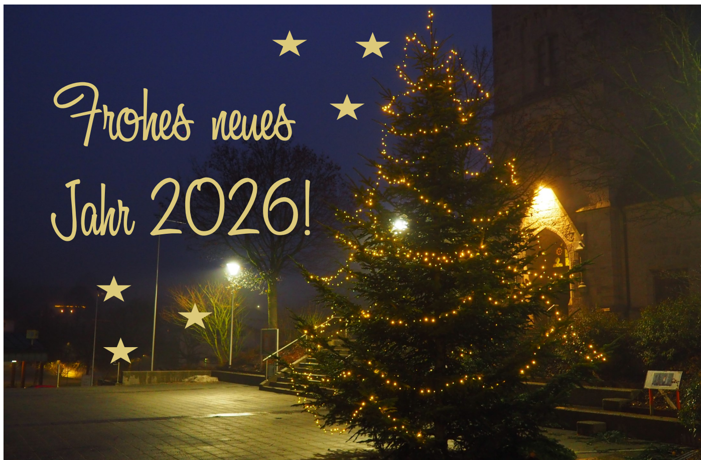
Weihnachtlich beleuchteter Christbaum am Ortsplatz der Gemeinde Nußbach