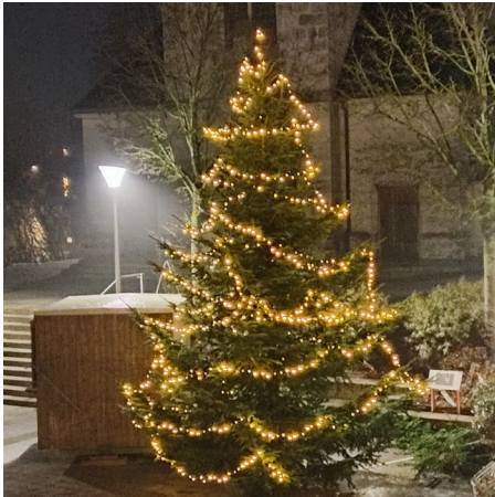
Christbaum am Kirchenplatz

Herzlich bedanken darf ich mich für das Binden des großen Adventkranzes am Ortsbrunnen bei der Goldhauben- und Trachtengruppe Nußbach und bei Familie Winkler für die Spende des Christbaumes am Kirchenplatz!