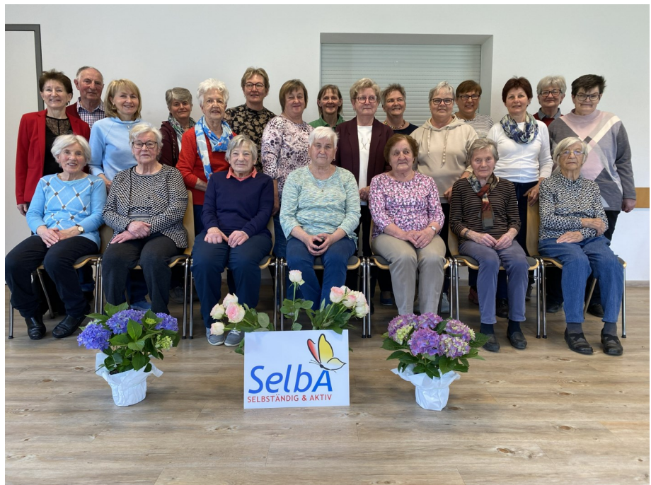
Die SelBA-Gruppe Nußbach

Weitere Informationen bei Monika Langeder (0677 61690105) oder Renate Winter (0664 413025)