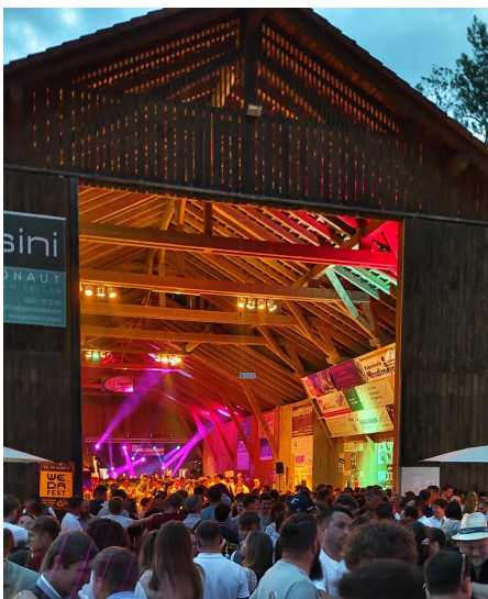
Partystimmung pur bei der Mostkost

Mit einem abwechslungsreichen Programm, vom Frühschoppen über musikalische Darbietungen bis hin