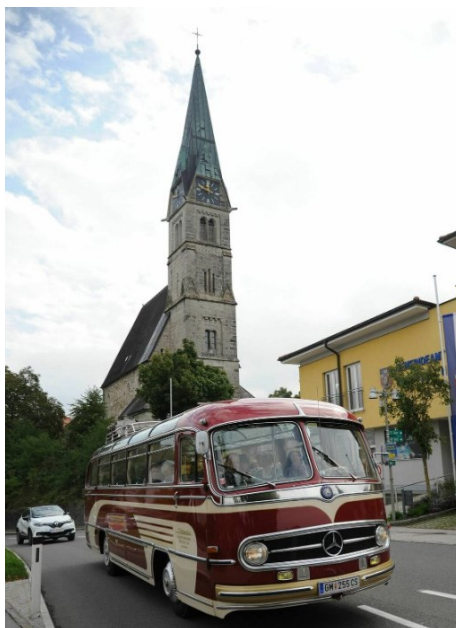
Der Oldtimer-Bus bei der Ausfahrt 2025

Goldene, Diamantene, Eiserne, Steinerne, Gnaden- und Kronjuwelnhochzeit