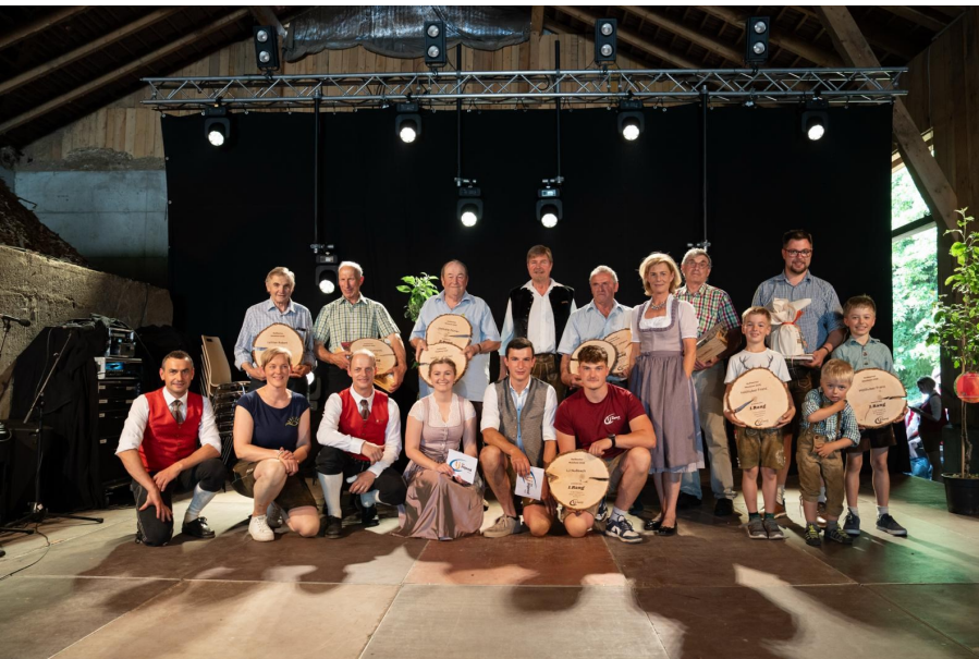
Große Freunde auf der Bühne bei der Nußbacher Mostkost

Ein besonderes Dankeschön gilt auch der Nahwärme für die zur Verfügungstellung des Veranstaltungsgeländes sowie unseren Sponsoren für die finanzielle Unterstützung. Anfang Juni ließen wir die Mostkost bei einem gemütlichen Frühschoppen und Veranstaltungsrückblick ausklingen.