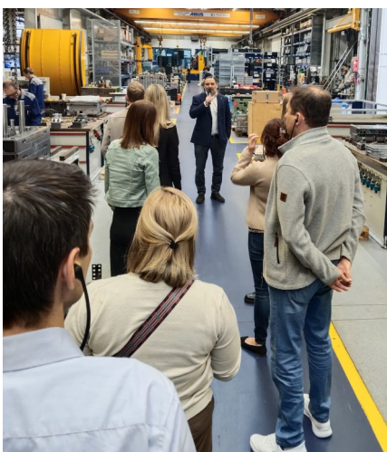
Die Teilnehmerinnen und Teilnehmer lauschten gespannt den Ausführungen von Herrn Haidlmair

Die Firma Haidlmair stand mehrfach im Mittelpunkt von Veranstaltungen. Neben der sehr gut be-