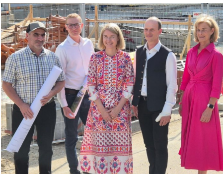
Baustellenbesichtigung mit Landesrätin Christine Haberlander

Der Umbau und Neubau des Kindergartens schreitet zügig voran. Mittlerweile konnte bereits der erste Bewegungsraum im bestehenden Gebäude saniert und fertiggestellt werden. Parallel wächst der Neubau stetig weiter. Auch das Unterge-