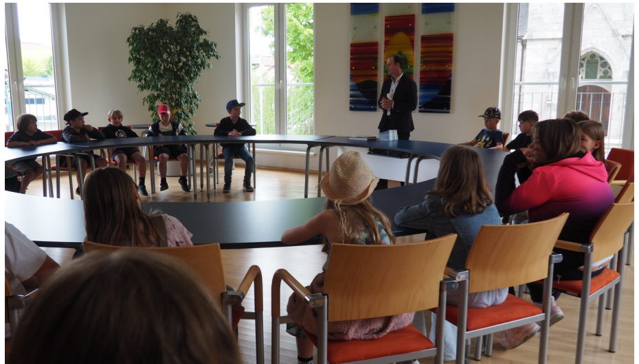
Die Kinder der VS Nußbach im Sitzungssaal der Gemeinde gemeinsam mit dem Bürgermeister

Über den Besuch der Schülerinnen und Schüler der dritten Klassen Volksschule freute sich das Team des Gemeindeamts sehr.