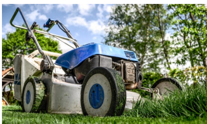
Rasenmäher im Garten

Die Verletzung der Verbote ist Verwaltungsübertretungen und von der Bezirksverwaltungsbehörde mit einer Geldstrafe von bis zu 360 Euro zu bestrafen.