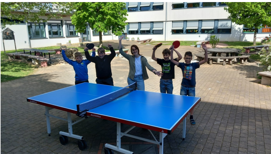
Die Kinder freuten sehr über diesen Outdoor-Tisch