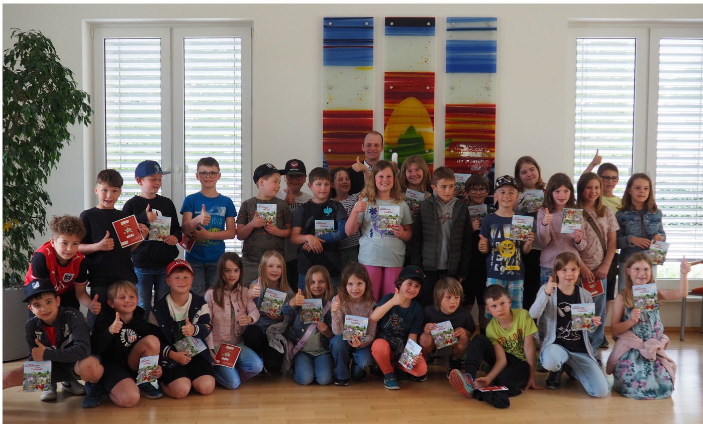
Die Kinder der 3. Klassen der Volksschule informierten sich bei Bürgermeister Ing. Gerhard Gebeshuber im Sitzungssaal der Gemeinde Nußbach über die vielfältigen Aufgaben der Gemeinde.

Ferienprogramm 2026: Bitte beachten Sie die Innenseiten dieser Ausgabe mit den diesjährigen Aktivitäten für die Kinder!