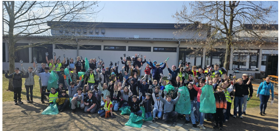
Die Kinder freuten sich über die erfolgreiche „Hui statt Pfui“ Aktion

Vor den Osterferien stimmte ein gemeinsamer Ostergottesdienst auf die freie Zeit ein. Rund um Ostern sammelten unsere SchülerInnen zudem wieder Spenden für die Krebshilfe ÖÖ – vielen Dank an alle UnterstützerInnen! Dieses Engagement wurde beim Pink-Ribbon-Lauf in Bad