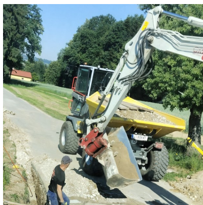
Der Bagger ist bereits im Einsatz.

Bauarbeiten werden aktuell nicht nur im Glasfaserbereich durchgeführt, auch im Straßenbau werden einige Teilstücke saniert.