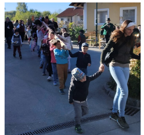
Der "kleine" Maibaum wurde von den Kindern stolz zum Aufstellort getragen.