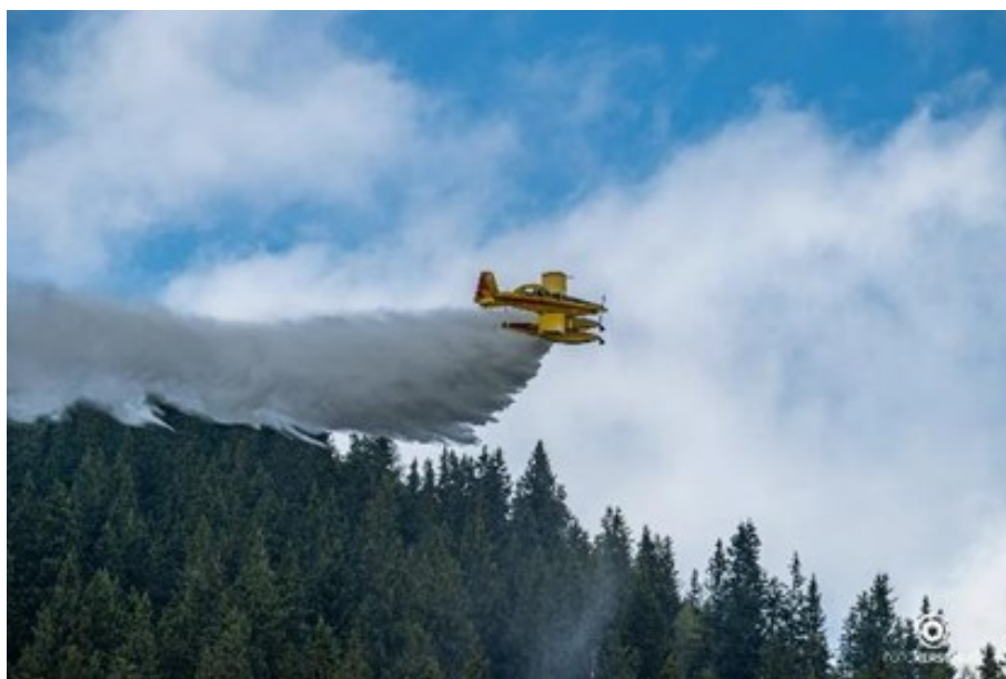
Das Löschflugzeug im Einsatz

stoff. Hierfür wurden zwei mobile Tankstellen als Stützpunktgeräte des Landesfeuerwehrverbandes in Nußbach stationiert. Detaillierter Bericht und Fotos auf ki.oelfv.at oder auf Fotokerschi.at